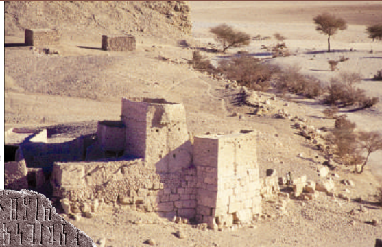
FOUILLES DE SHABWA V Les fortifications