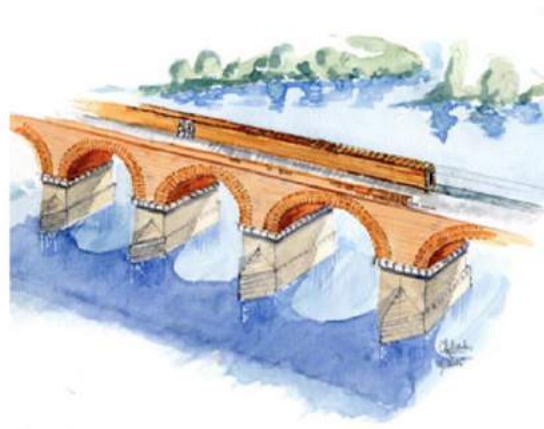
Figure 3. Dessins de Christian Darles, d'après les travaux de Badié et Gassend