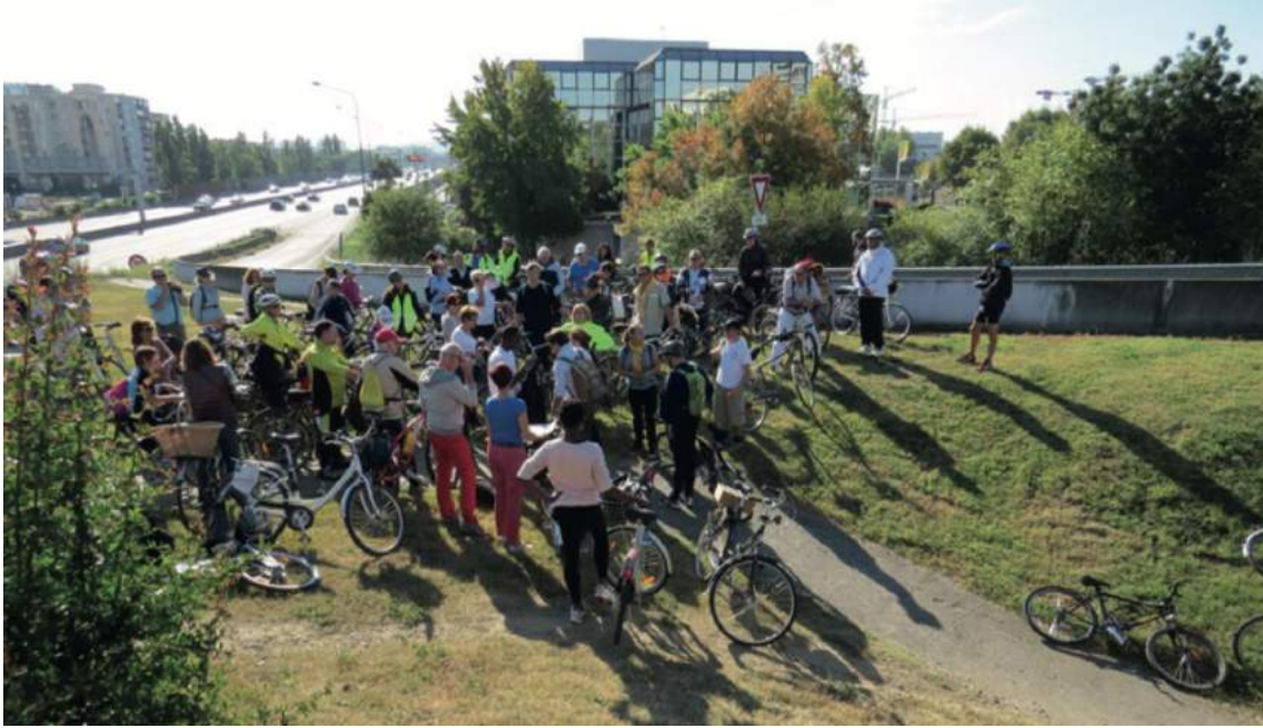
Figure 4. En suivant le tracé de l'aqueduc (randonnée métropolitaine du 11 octobre 2015).