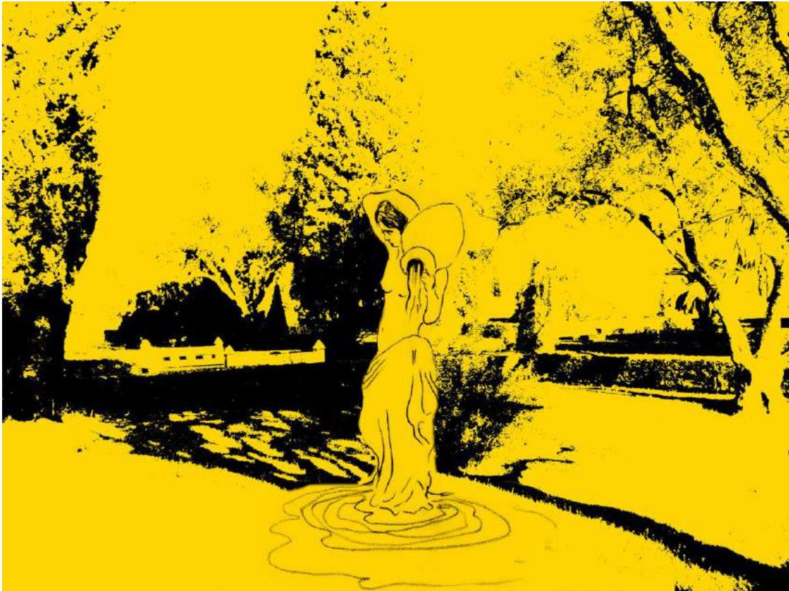
Figure 2. « [...] une très jolie fontaine en faïence de couleur, figurée par une femme grandeur nature portant une cruche sur l'épaule d'où coulait l'eau, recueillie à ses pieds, dans une vasque de forme ovale » Création visuelle Didier Tallagrand